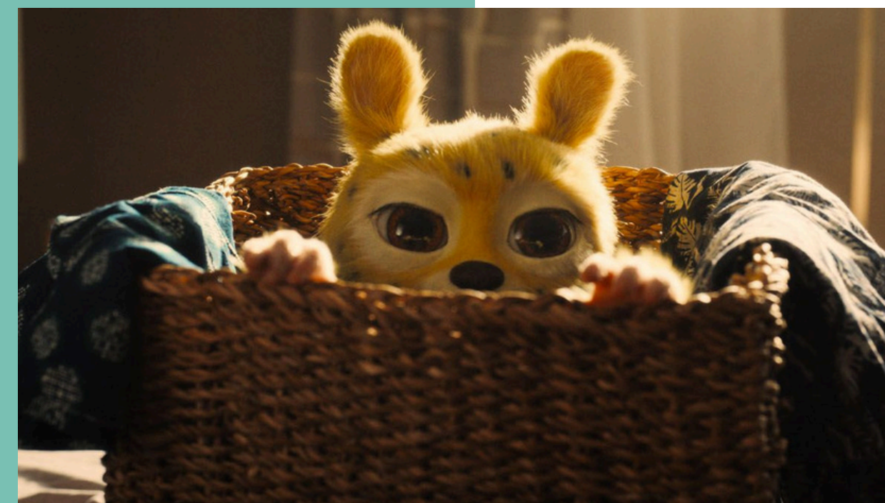
Marsupilami de Philippe Lacheau