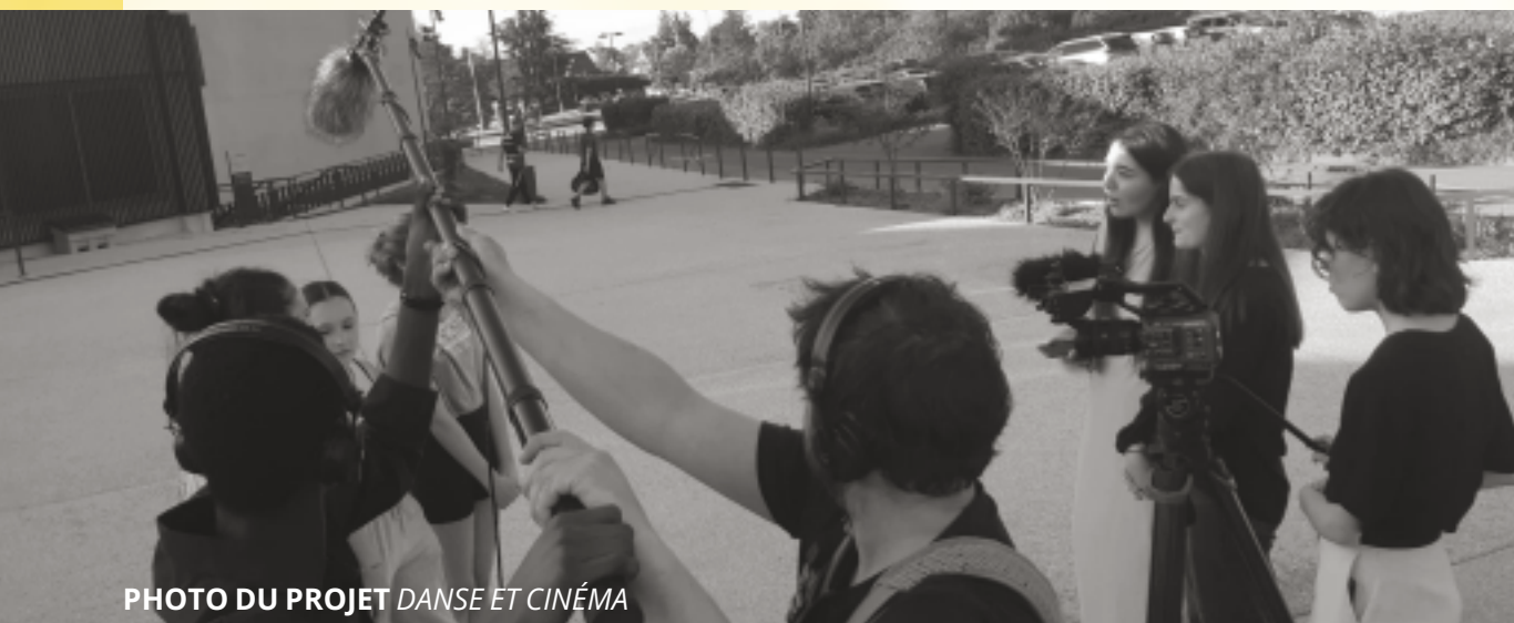
PHOTO DU PROJET DANSE ET CINÉMA