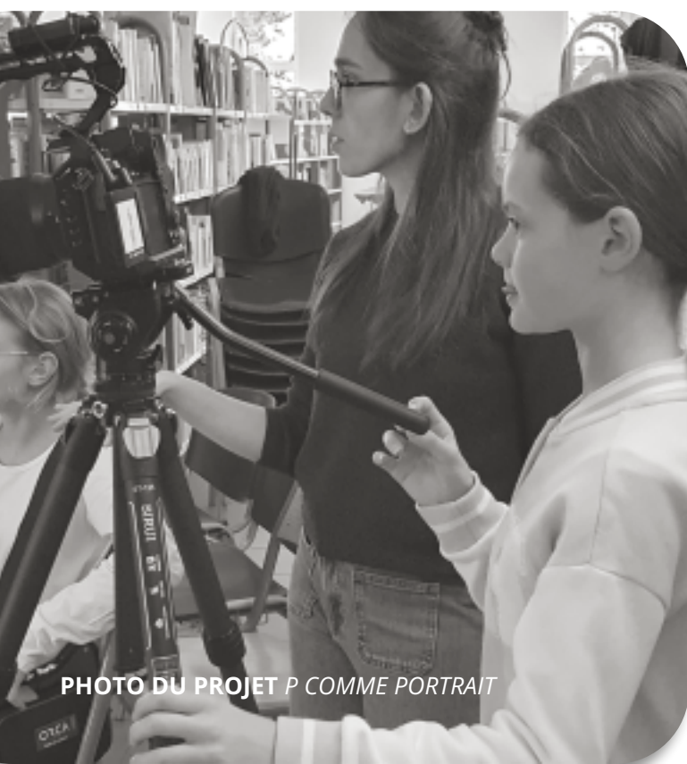
PHOTO DU PROJET P COMME PORTRAIT

15 projets sur les 17 soumis au comité de pilotage ont été soutenus par le dispositif Passeurs d'images ; répartis sur 5 départements de la région, entre Quartiers Prioritaires de la Ville (QPV) et Zone Prioritaires de Revitalisation (ZRR).