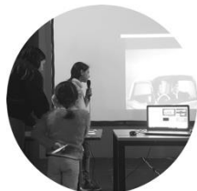
Table Mashup. Un outil interactif à la découverte du montage, du doublage, du son sur des images d'archives ou originales, fixes ou animées, prises de vues réelles ou dessinées.