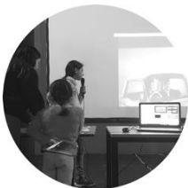
Table Mashup. Un outil interactif à la découverte du montage, du doublage, du son sur des images d'archives ou originales, fixes ou animées, prises de vues réelles ou dessinées.